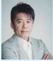
インターステラテクノロジズ株式会社 創業者 堀江 貴文氏